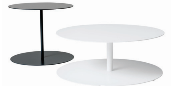
tavolini / service tables

GG_1 service table GG_2 low service table