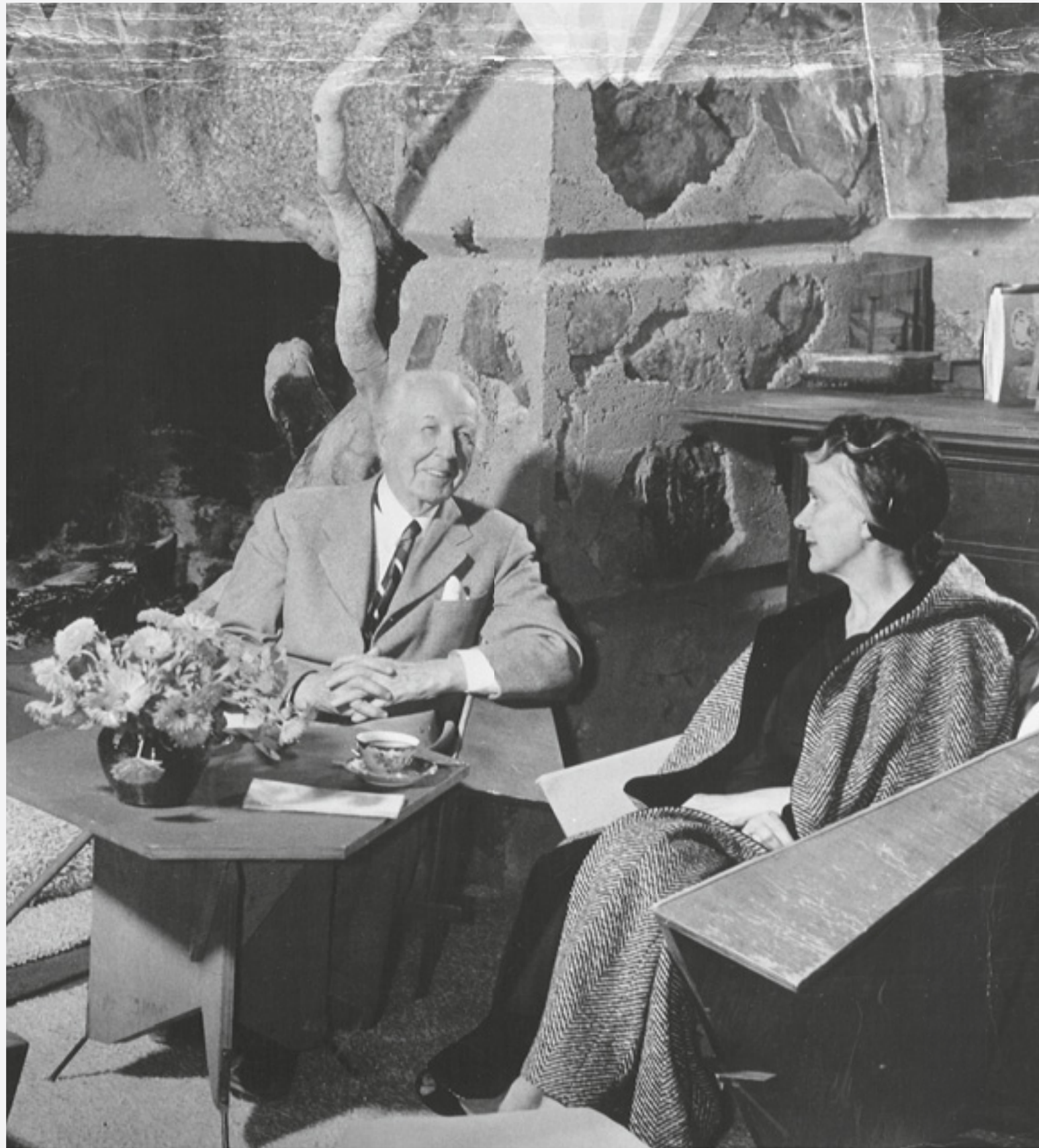
Frank Lloyd Wright e sua moglie seduti sulla poltrona Taliesin, 1957, Taliesin West /Frank Lloyd Wright and his wife sitting on Taliesin Armchair, 1957 Taliesin West