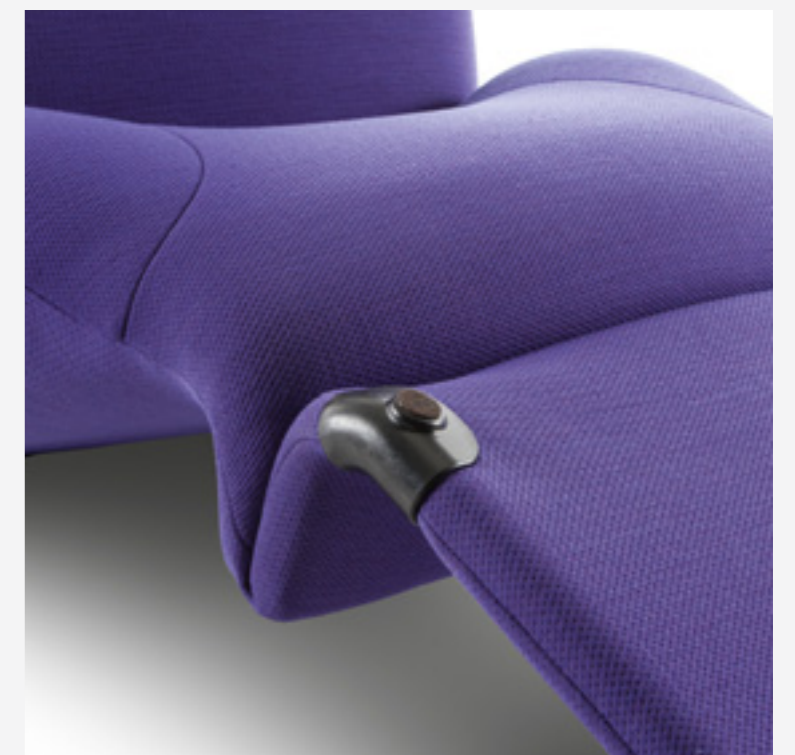
Dettaglio dei punti di appoggio a terra/Detail of floor support/ Detail der Stützpunkte am Boden/Détail des points d'appui par terre